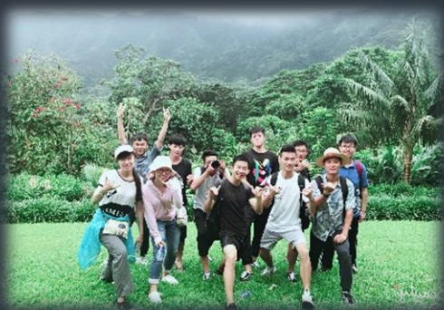
夏威夷自然人文探索 & 校外参观